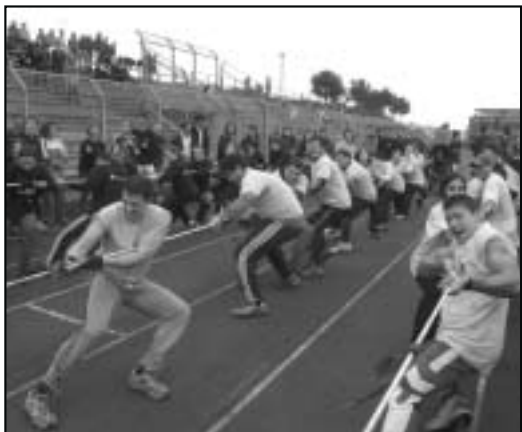
Corsa con i sacchi e tiro alla fune: due momenti delle gare sportive della Giornata dello Studente