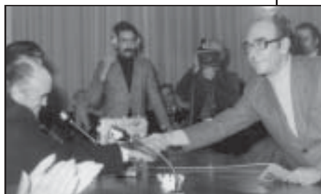
1975: Sebastiano Addamo riceve il premio Brancati per il suo libro "Il giudizio della sera".