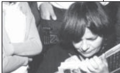
1968: Elsa Morante intenta ad autografare una copia del suo libro "Il mondo salvato dai ragazzini", per il quale ricevette il Brancati, quell'anno alla prima edizione.